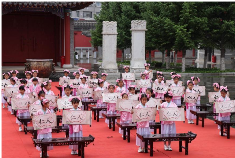
长春市南关区第三幼儿园小朋友参加启蒙仪式现场

2023 年，我馆以线下线上相结合的方式，举办了丰富多彩的公益文化活动，共举办 130 场线下活动，323 场线上活动，包括节庆日公益文化活动、国学大讲堂、成人礼、启蒙礼、红色故事宣讲、五育主题实践活动、廉政主题教育活动等，丰富市民精神文化生活，弘扬中华优秀传统文化，增强文化自信。