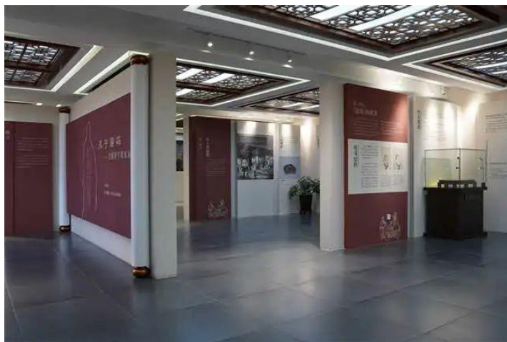
孔子密码——主题研学探索展

2023 年，我馆与孔子博物馆首度合作，引进了“孔子密码——主题研学探索展”，并策划了“孔子密码”流动展览进校园活动，截至 2023 年年底，流动展览共走进长春市 6 家中小学进行巡展。