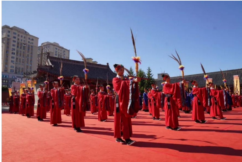
孔子诞辰 2574 周年纪念仿古释奠礼表演

2023 年 7 月 7 日至 20 日，“精彩夜吉林·2023 消夏演出季”主会场演出在长春文庙广场举行，21 个剧种及艺术表演形式，14 场文艺演出轮番亮相，每天给 5000 多名市民呈现了一场场精彩的视听盛宴；第五届“吉林非遗节”也在长春文庙广场同期举行，朝鲜族泡菜制作技艺、知北村粉坊漏粉技艺、安图隋氏铁制品制作技艺、李氏葫芦画等多项传统技艺、传统美术、民俗、传统医药项目及实物商品在长春文庙广场展示、展售。