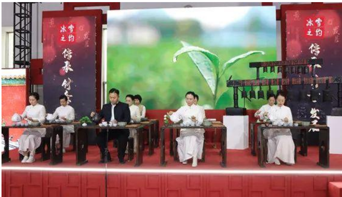
长春市文庙博物馆在“冰雪之约文博主题馆”带来茶艺表演