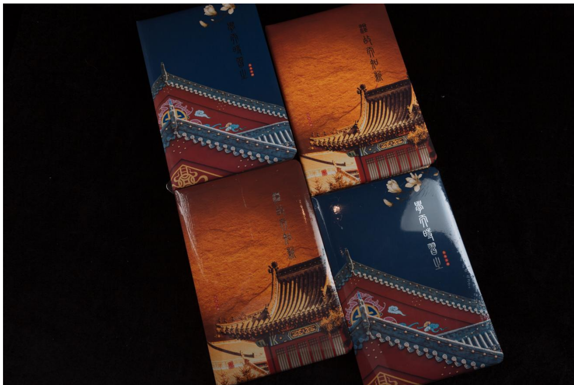
学而文创手账本、温故文创手账本

雕”“学而文创手账本、温故文创手账本”等文化产品。其中，“学而文创手账本、温故文创手账本”被评为2023年“长春礼物”。