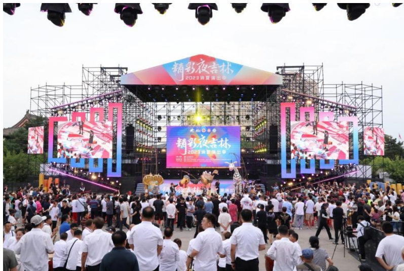
“精彩夜吉林·2023 消夏演出季”活动现场

2023 年 7 月 7 日至 20 日，“精彩夜吉林·2023 消夏演出季”主会场演出在长春文庙广场举行，21 个剧种及艺术表演形式，14 场文艺演出轮番亮相，每天给 5000 多名市民呈现了一场场精彩的视听盛宴；第五届“吉林非遗节”也在长春文庙广场同期举行，朝鲜族泡菜制作技艺、知北村粉坊漏粉技艺、安图隋氏铁制品制作技艺、李氏葫芦画等多项传统技艺、传统美术、民俗、传统医药项目及实物商品在长春文庙广场展示、展售。